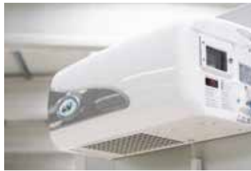
Namhaftes Kälteaggregat mit 24-Stunden-Notfallhotline