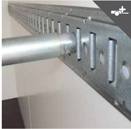
Ankerschiene für Sperrstange