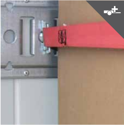
Ankerschiene für Spanngurte