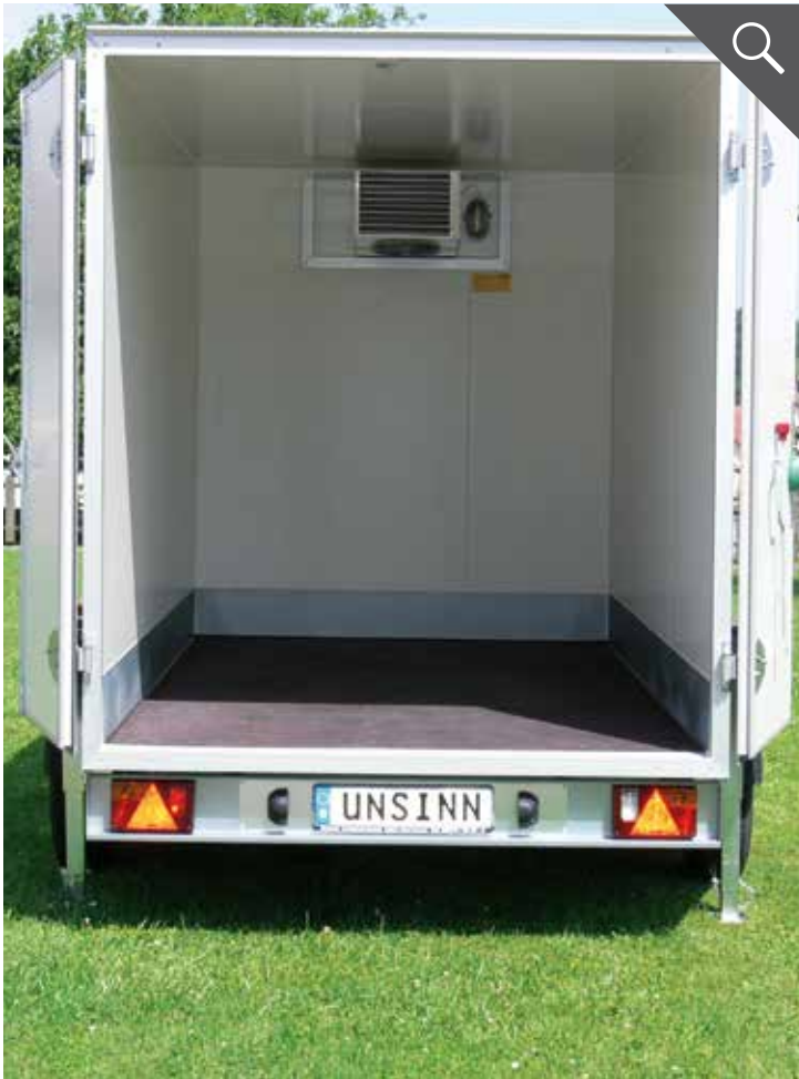
Rutschhemmende Bodenplatte mit Scheuerleiste