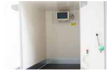
Betrieb mit umweltfreundlichem FCKW-freien Kältemittel