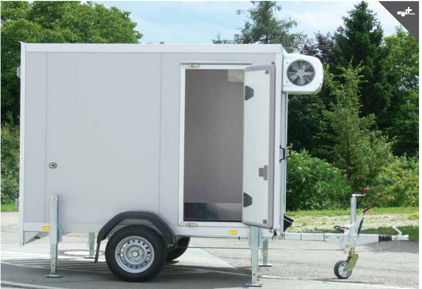
Seitentüre mit Drehstangenverschluss