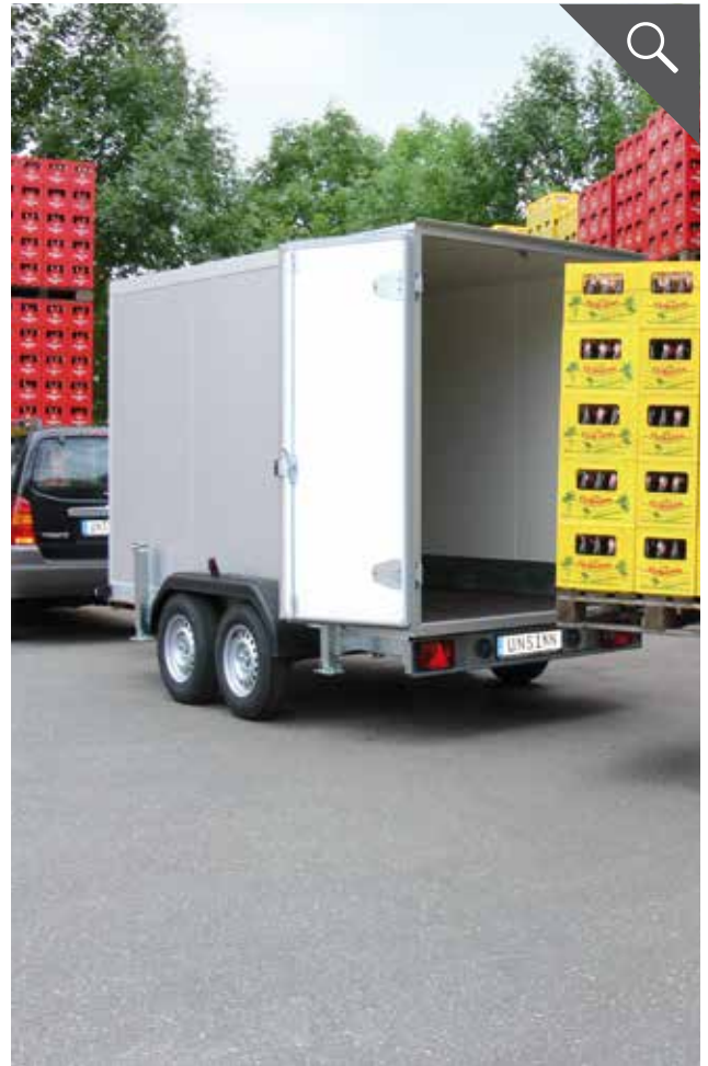
Einfaches Beladen durch optimale Höhe