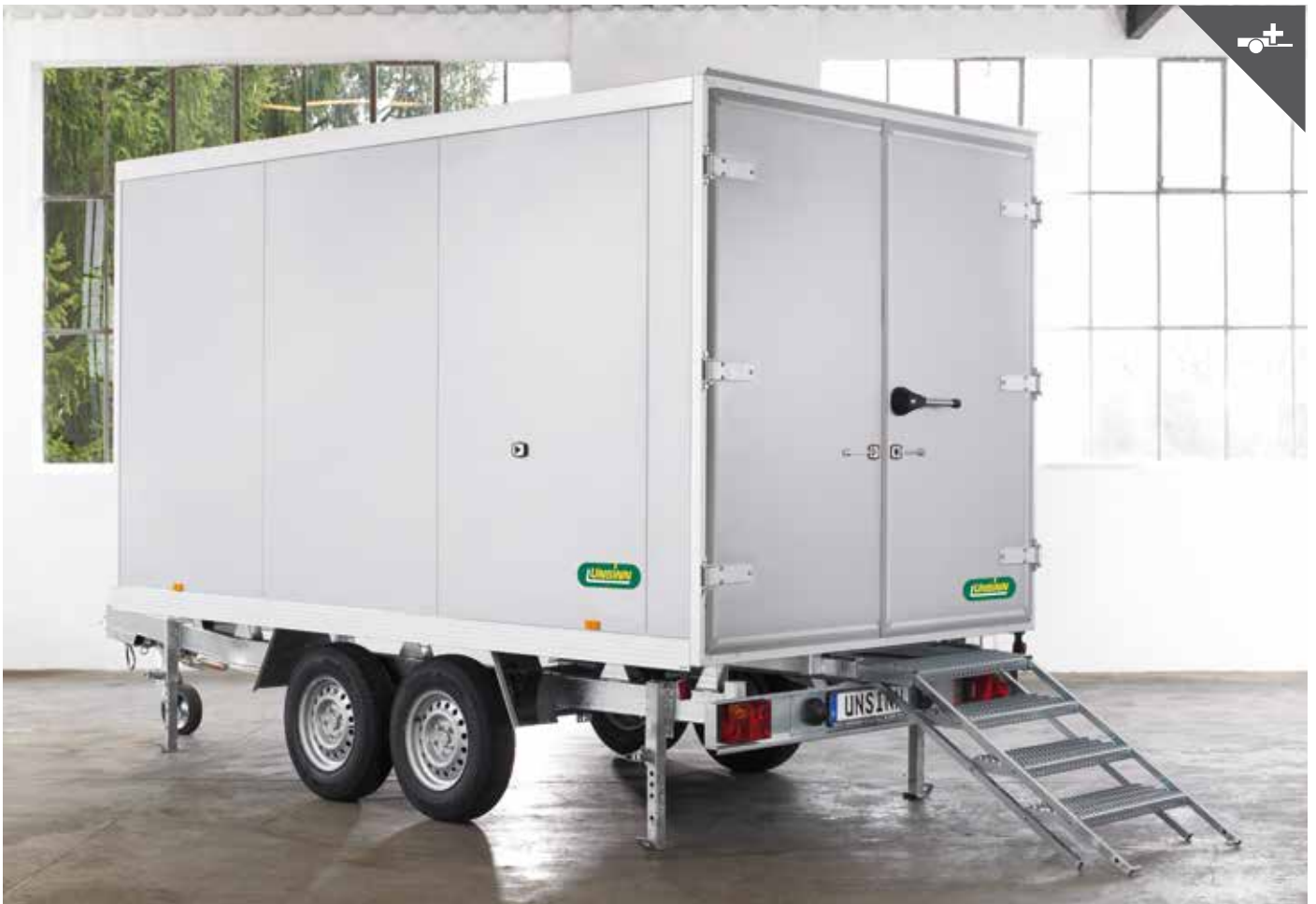
Treppe unterhalb der Ladefläche für einfaches Betreten des Anhängers (Typ C6 3536-14-2040 / Hochlader)